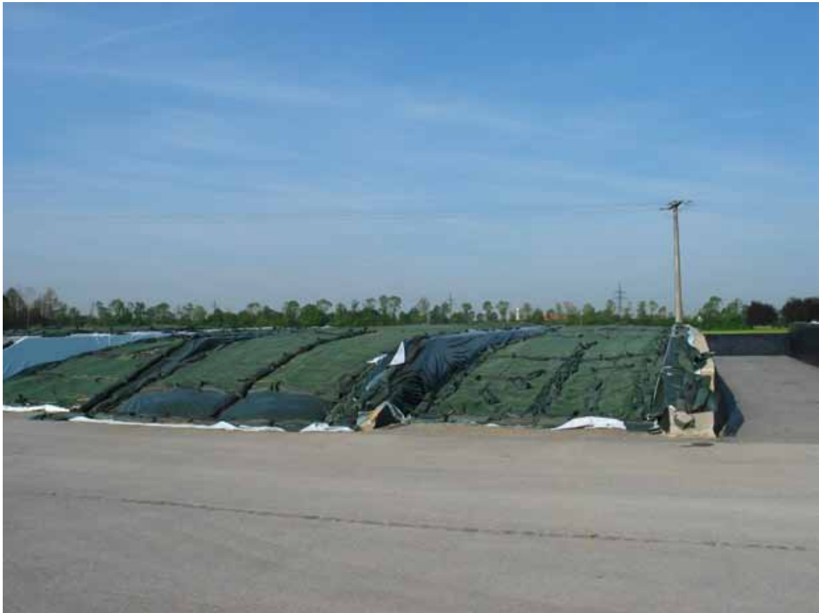
Abb. 3: Fahrsiloplanlage mit vollständiger Abdeckung

Die Anlage des Silos und das Silomanagement sind die entscheidenden Ansatzpunkte, den Anfall gering zu halten.