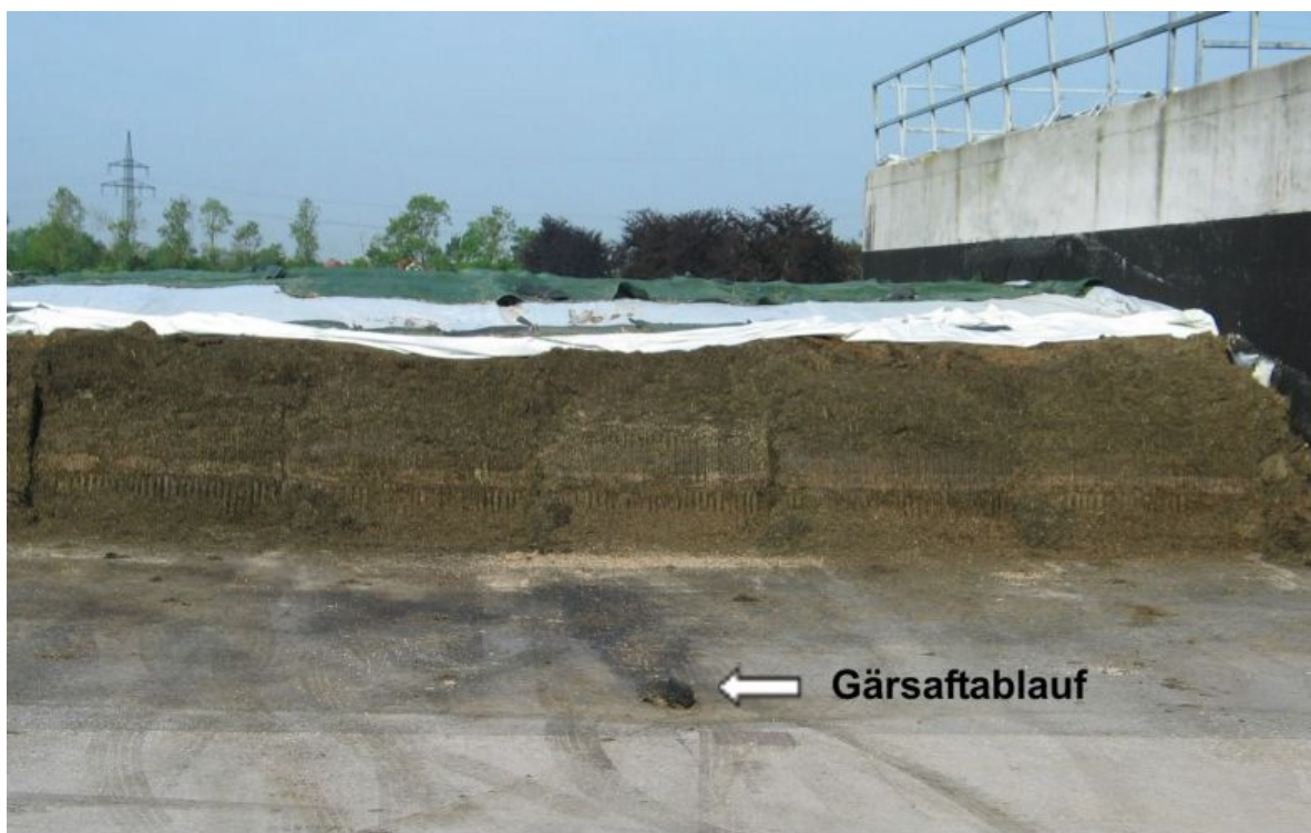
Abb. 4: Grassilage im Anschnitt mit Gärssaftablauf

Bei größeren Siloanlagen ist die Entwässerung in Teilflächen zu prüfen, um nicht verunreinigtes von verunreinigtem Niederschlagswasser zu trennen.