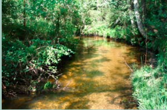
Fintau mit naturnahem Umfeld