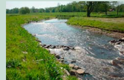
Umgestaltung der Schleuse zur Sohlgleite (2005)