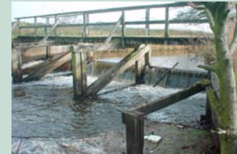
Wümme-Nordarm, Schleuse bei Fischerhude

In den letzten Jahren wurden zahlreiche Stauwehre und Schleusen mit Steinen unterschiedlicher Größe zu flach geneigten Rampen, den sogenannten Sohlgleiten, umgestaltet. Viele Laichplätze der Flussneunaugen in den Oberläufen der Flüsse und Bäche im Wümmegebiet sind nun wieder erreichbar. Im Wümme-Nordarm wurden bereits Flussneunaugen nachgewiesen, bei denen von einer erfolgreichen Vermehrung ausgegangen werden kann. Auch in den Nebengewässern der Wümme wie Fintau, Veerse, Wiedau und Wieste wurde das Flussneunauge in größerer Anzahl angetroffen. Das Flussneunauge unternimmt somit wieder Wanderungen aus der Nordsee in die oben genannten Gewässer, bei denen es Strecken von mehr als 100 Kilometer zurücklegt.