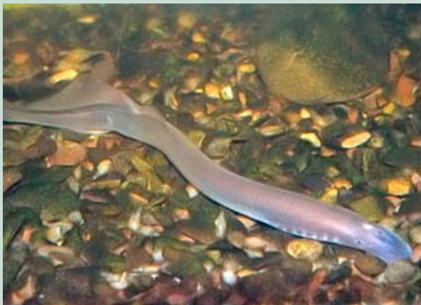
Flussneunauge – geschützt, nach der Flora-Fauna-Habitat-Richtlinie und nach Roter Liste als „stark gefährdet“ eingestuft

Das Flussneunauge zählt zu den Rundmäulern und hat damit nur äußerlich eine große Ähnlichkeit mit Fischen. Rundmäuler sind entwicklungsgeschichtlich die Vorgänger der Fische, die sich seit 500 Millionen Jahren kaum verändert haben. Im Gegensatz zu Fischen besitzen sie keine Schuppen, keine paarige Brust- und Bauchflosse und anstelle des Kiefers ein mit Hornzähnen besetztes rundes Saugmaul. Seinen Namen verdankt das Flussneunauge den sieben auf jeder Körperseite nacheinander angeordneten Kiemenöffnungen sowie einem Auge und Geruchsorgan. Die 30 bis 40 cm langen aalförmigen Tiere laichen zwischen Februar und Mai in kiesig-sandigen vorzugsweise beschatteten Flachwasserbereichen mit geringer