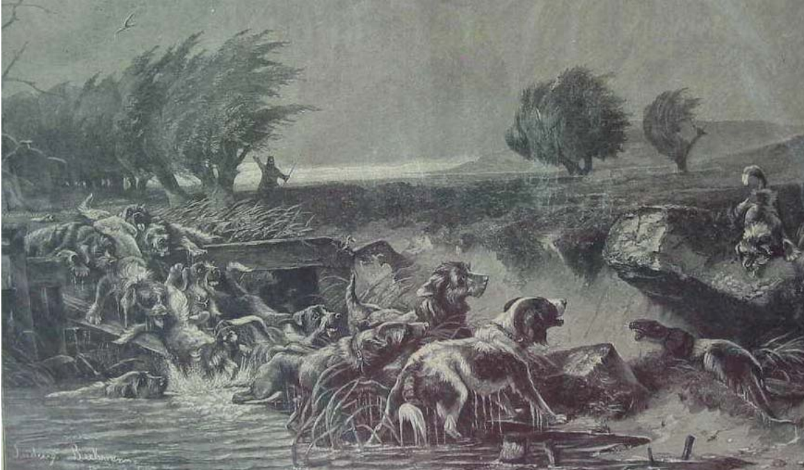
Otterjagd mit Hunden / Holzstich, ca. 1850

Durch das Landesjagdgesetz vom 13.4.1973 wurde Eigentümern oder Nutzungsberechtigten von geschlossenen Gewässern allerdings wieder die Möglichkeit gegeben, auf Antrag Fischotter zu jagen. Durch die Novellierung des Landesjagdgesetzes vom 24.2.1978 wurde dem Artenschutz allerdings größeres Gewicht verliehen, so daß seitdem die Möglichkeit der Ausstellung von Ausnahmegenehmigungen für die Tötung von Fischottern nach diesem Gesetz nicht mehr gegeben ist. (REUTHER 1980: 37ff.)