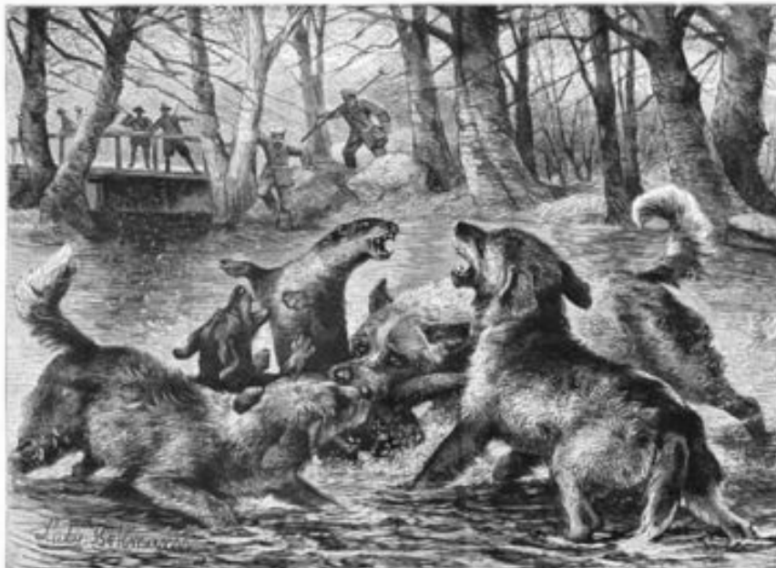
Fischotterjagd, Hunde und Otter im Kampf Holzstich 1884