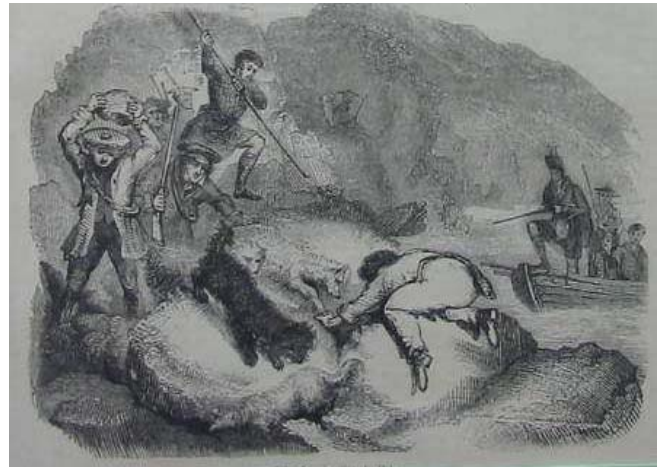
Otterjagd / Holzstich, ca. 1850