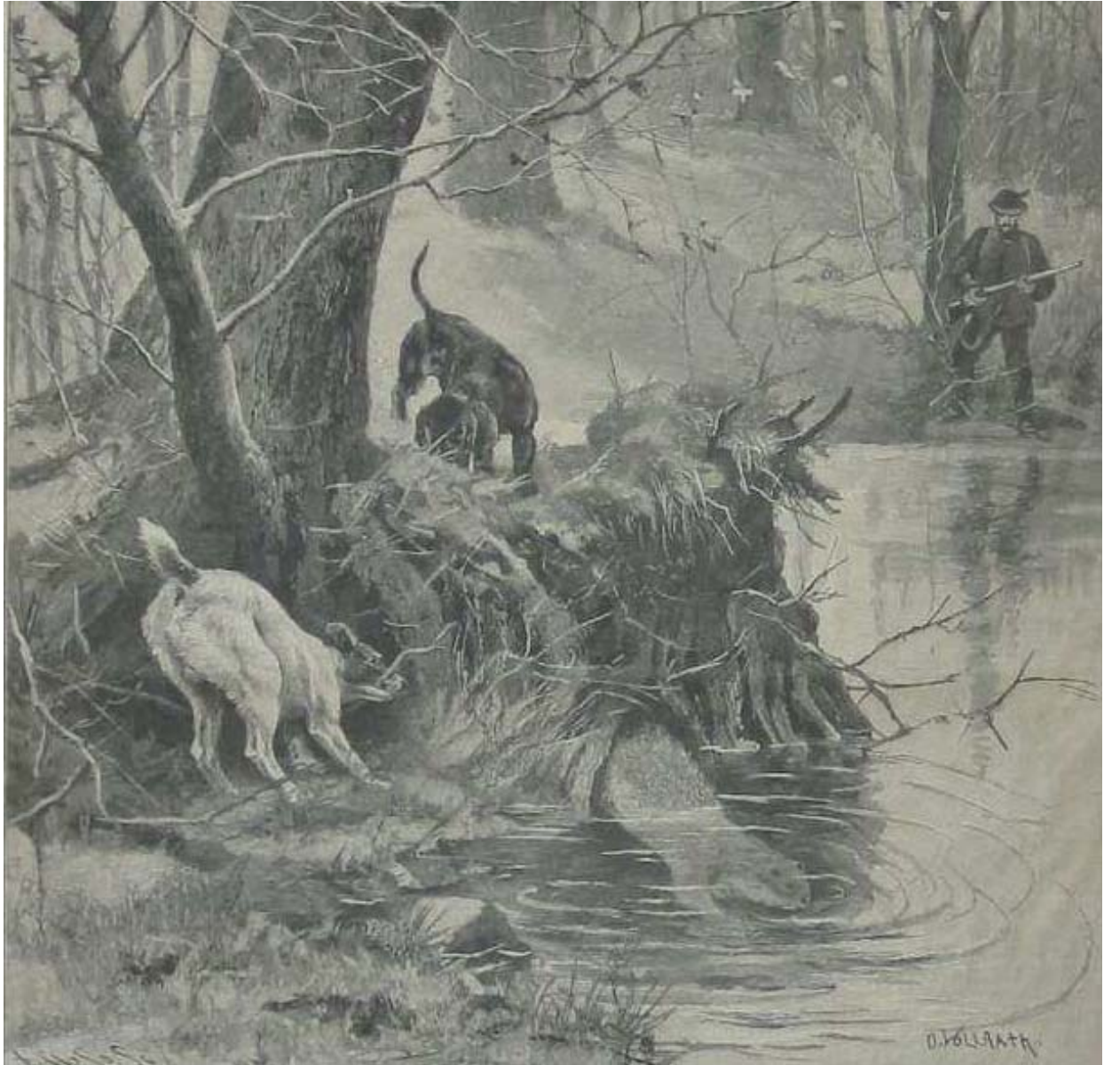
Otterjagd / Am Fischotterbau, Holzstich 1892

dann nach der Statistik der Kgl. Landwirtschaftsgesellschaft im Amt Rotenburg 26-50 erlegte Fischotter registriert.